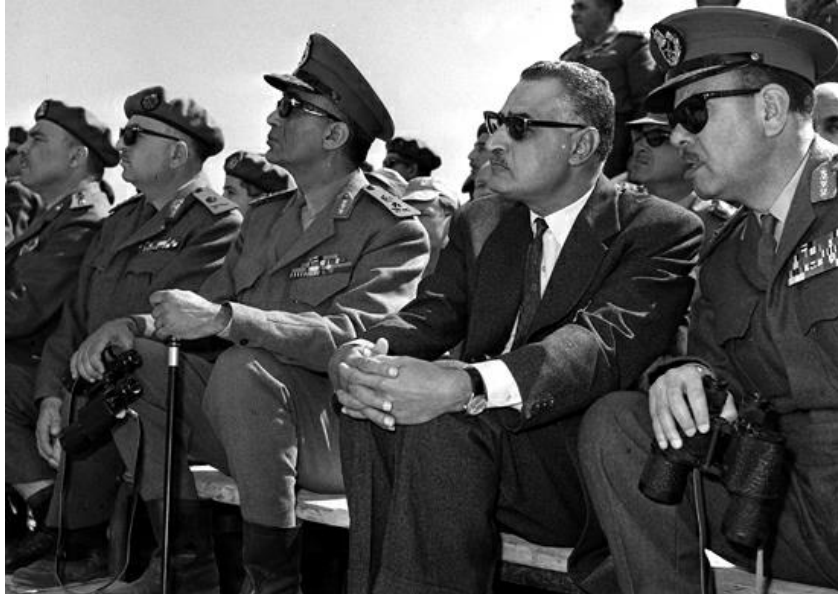
عبد الناصر في الجبهة ١١/٣/١٩٦٨